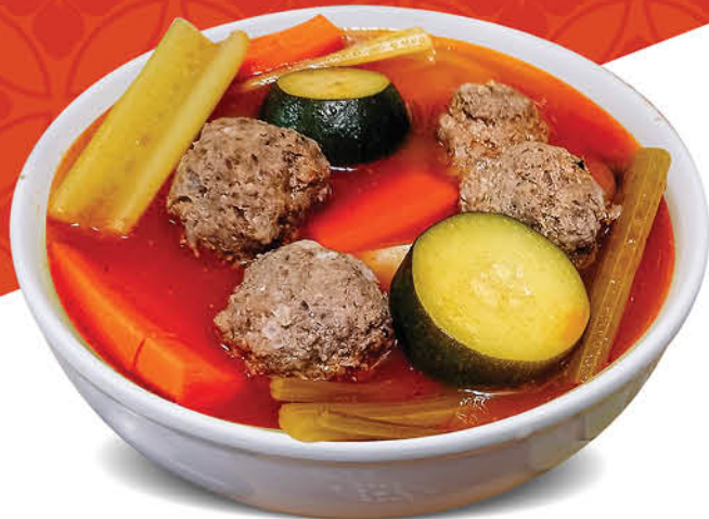
*CALDO de Albondigas Meatball Soup